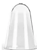
4) מגן למתאם ראש