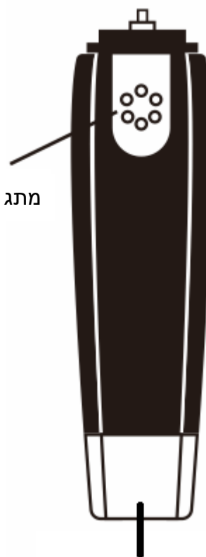
3) מתג הפעלה/כיבוי